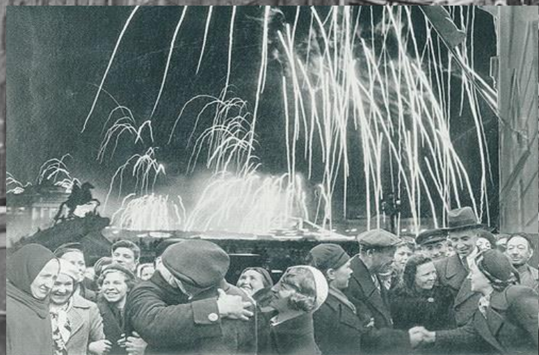
«ВЕЛИКАЯ ПОВЕДА ОДЕРЖАНА СОВЕТСКИМИ ВОЙСКАМИ ПОД ЛЕНИНГРАДОМ:

Памятник-ансамбль «Разорванное кольцо» Здесь начиналась «Дорога жизни»