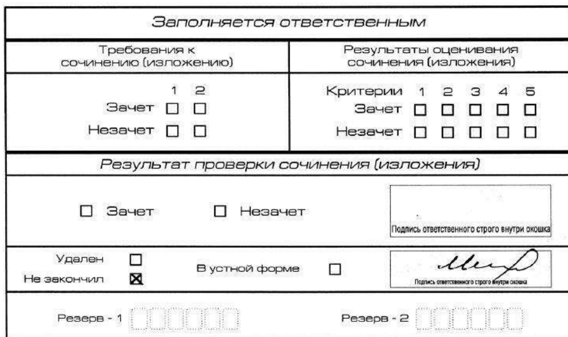
Рис. 12. Заполнение полей нижней части бланка регистрации (завершение написания сочинения (изложения) по уважительным причинам)

о досрочном завершении написания итогового сочинения (изложения) по уважительным причинам» (форма ИС-08), вносят соответствующую отметку в форму ИС-05 «Ведомость проведения итогового сочинения (изложения) в учебном кабинете ОО (месте проведения)» (участник итогового сочинения (изложения) должен поставить свою подпись в указанной форме). В бланке регистрации указанного участника итогового сочинения (изложения) необходимо внести отметку «X» в поле «Не закончил» для учета при организации проверки, а также для последующего допуска указанных участников к повторной сдаче итогового сочинения (изложения) в дополнительные сроки. Внесение отметки в поле «Не закончил» подтверждается подписью члена комиссии по проведению итогового сочинения (изложения) (см. рис. 12).