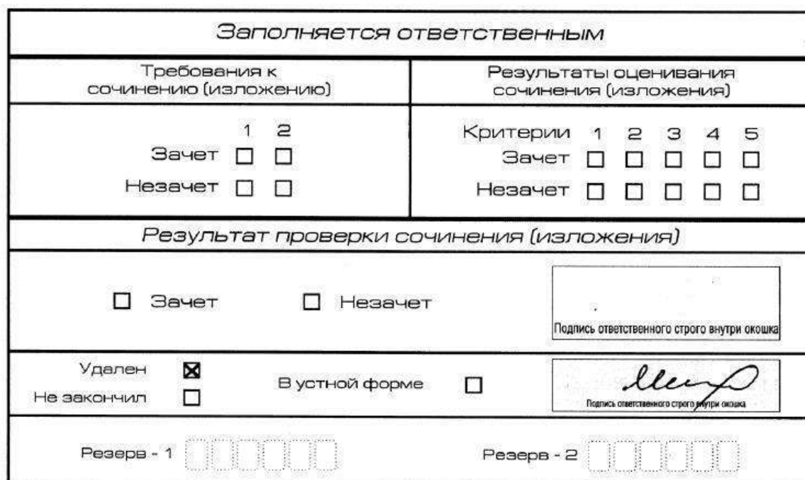
Рис. 13. Заполнение полей нижней части бланка регистрации (удаление с экзамена)