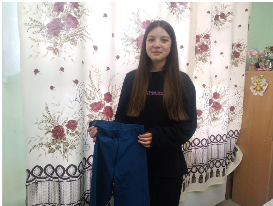
Готовый наряд для туристки